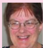
Agethe Zimino Korsvejskirken, Kbh.