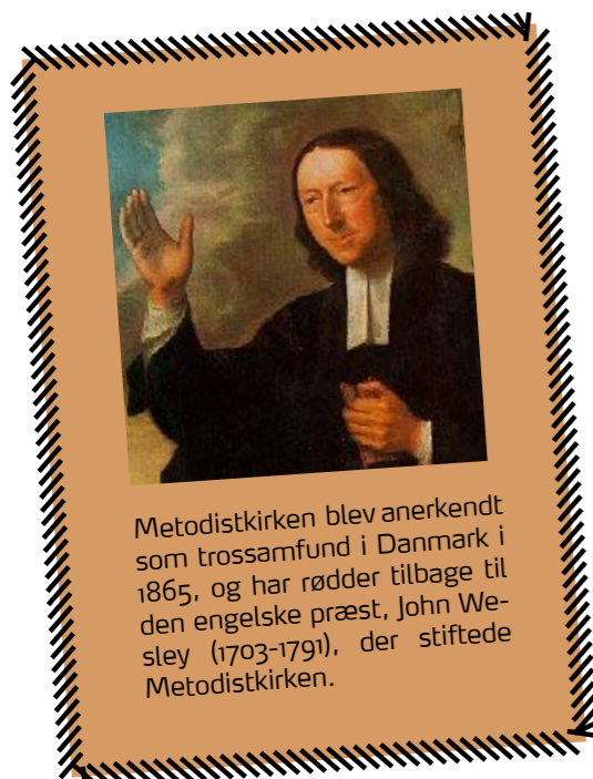
Metodistkirken blev anerkendt som trossamfund i Danmark i 1865, og har rødder tilbage til den engelske præst, John Wesley (1703-1791), der stiftede Metodistkirken.