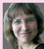
Bitten Ingerslev Kristent Fællesskab